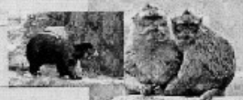
Voir les animaux du zoo

Les spectacles débutent à Pâques jusqu'à fin septembre.