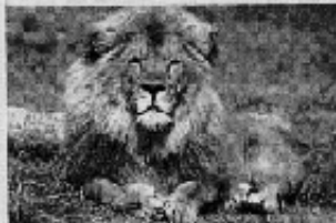
Voir les animaux du zoo

Avec ses 700 animaux provenant du monde entier, le Zoo vous propose 5 heures de visite et 3 spectacles 1